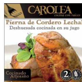
Pierna de Cordero Lechal (deshuesada y cocinada en su jugo)