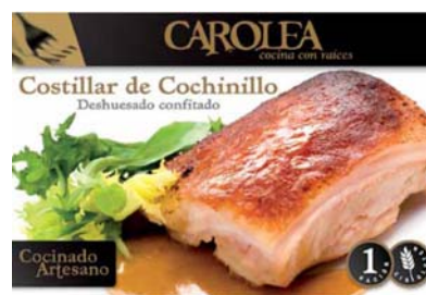
Costillar de Cochinito (deshuesado confitado)