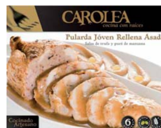
Pularda Joven Rellena Asada con salsa de Trufa y Puré de Manzana