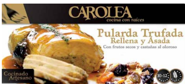
Pularda Trufada, Rellena y Asada con frutos secos y castañas al oloroso

Desde su fecha de envasado, todos los productos tienen una caducidad de 60 días, conservándose en refrigeración del 0° a 4° C. Una vez se abre el envase para su consumo, se puede conservar en refrigeración un máximo de 3 días.